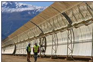
Solarthermie-Kraftwerk in Granada, Spanien.