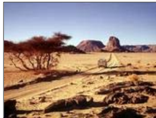
Wüste in Algerien (Archivbild)